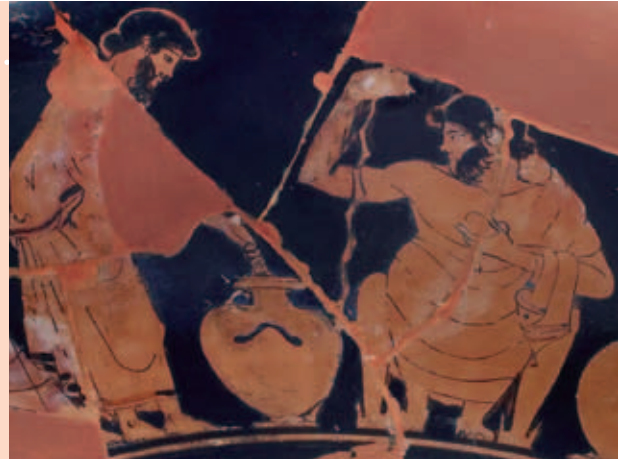
Détail d'un vase grec, V e siècle av. J.-C., Musée des Beaux-Arts, Dijon.

THUCYDIDE (v. 460-v. 400 av. J.-C.), Histoire de la guerre du Péloponnèse.